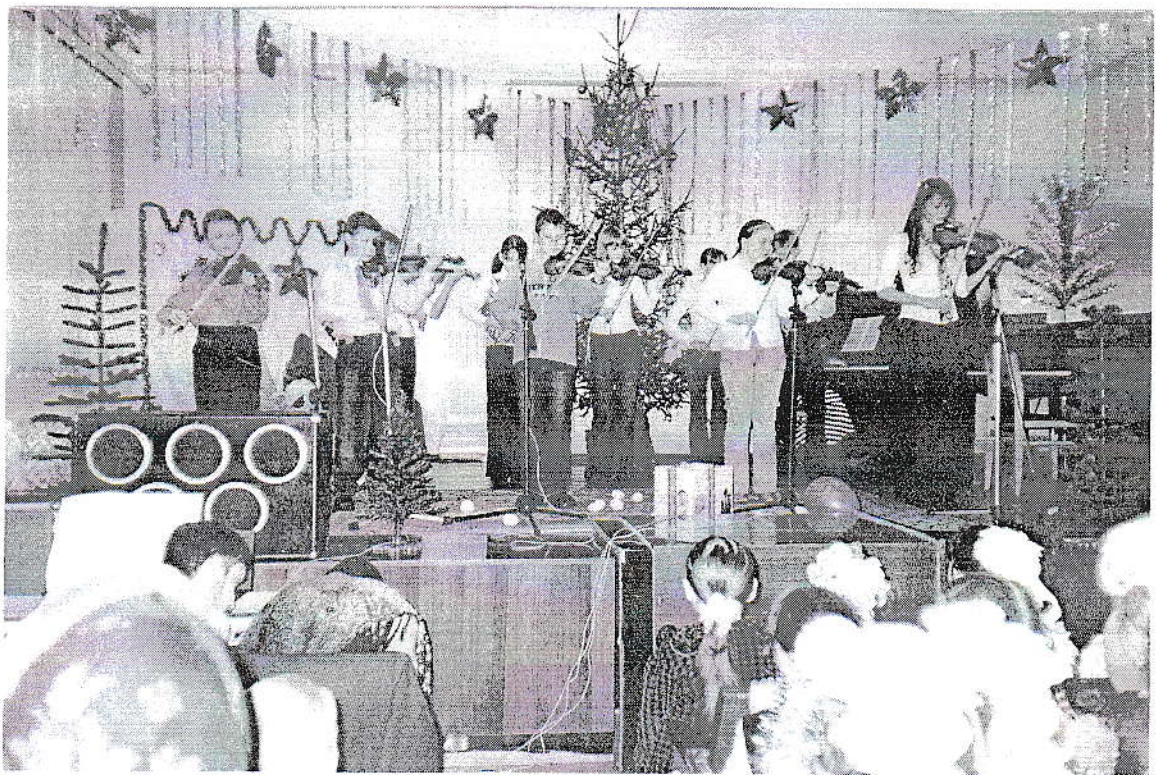
Ансамбль скрипачей «Вдохновение» (старший состав)