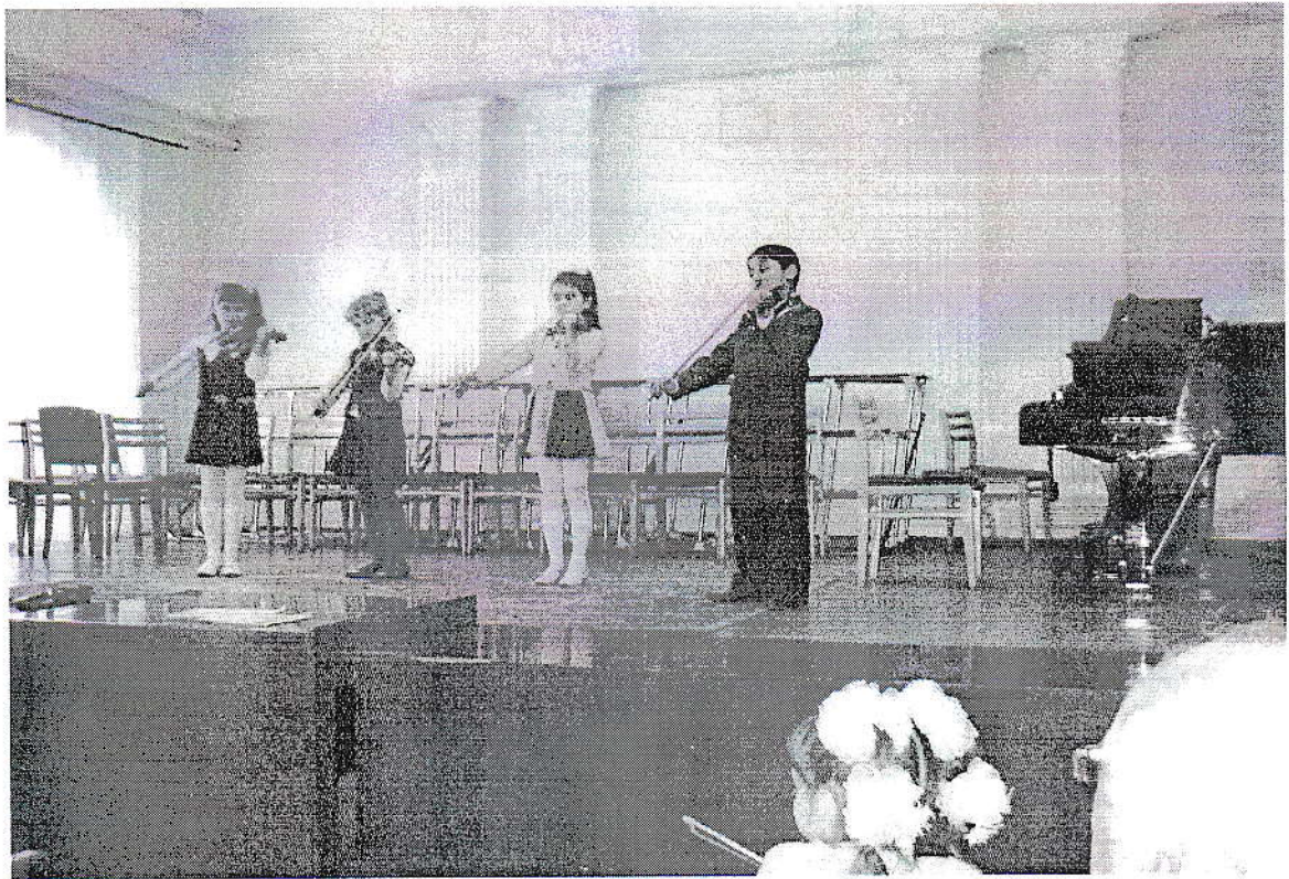
Ансамбль скрипачей «Веселые нотки» (младший состав)