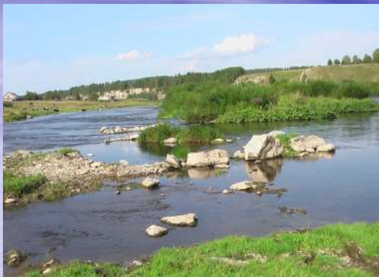
Камни на р. Чусовая