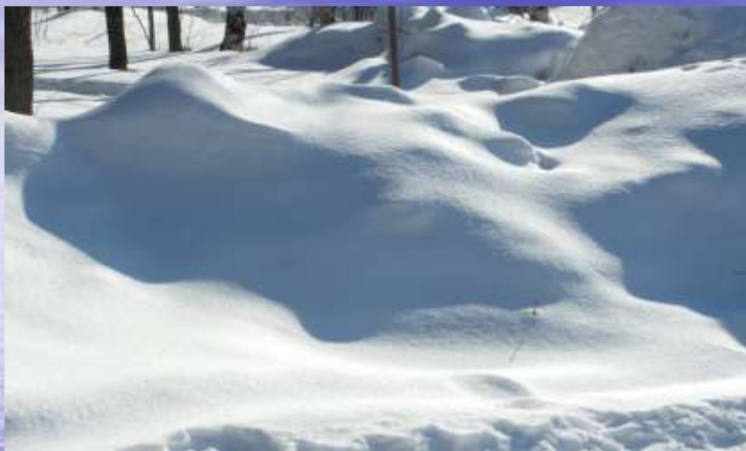
Сугробы в Гремячинске