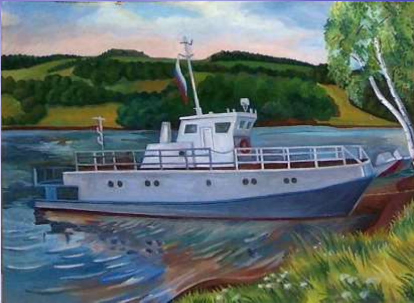
На Широковском водохранилище