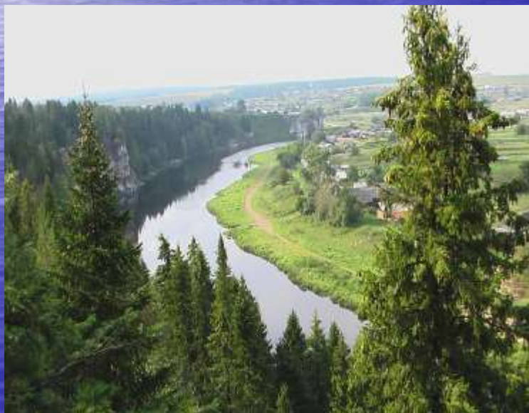
Вид на р. Чусовая со скалы